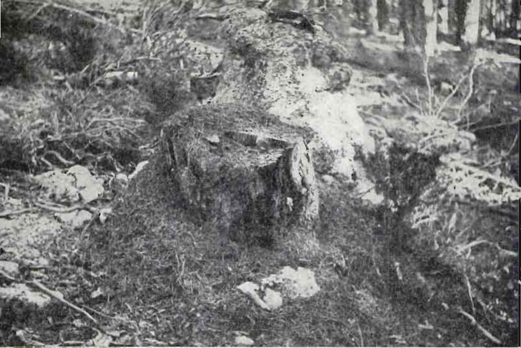
Fig. 2.—Formación de un nido de Formica lugubris sobre un tronco de pino.

celdas hexagonales de perfección geométrica; esto indica que las hormigas tienen una gran plasticidad de adaptación y de hecho vemos las variaciones en tamaño y forma de los hormigueros dentro de una misma especie y biotopo, según las estaciones y período de crecimiento de las colonias.