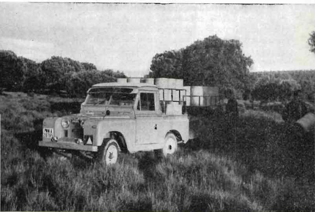
Fig. 4.—Transporte de hormigas en un vehículo todo terreno.

El trasplante se hará cuando tengamos plena certeza de la especie de que se trata; una vez seguros de que las hormigas