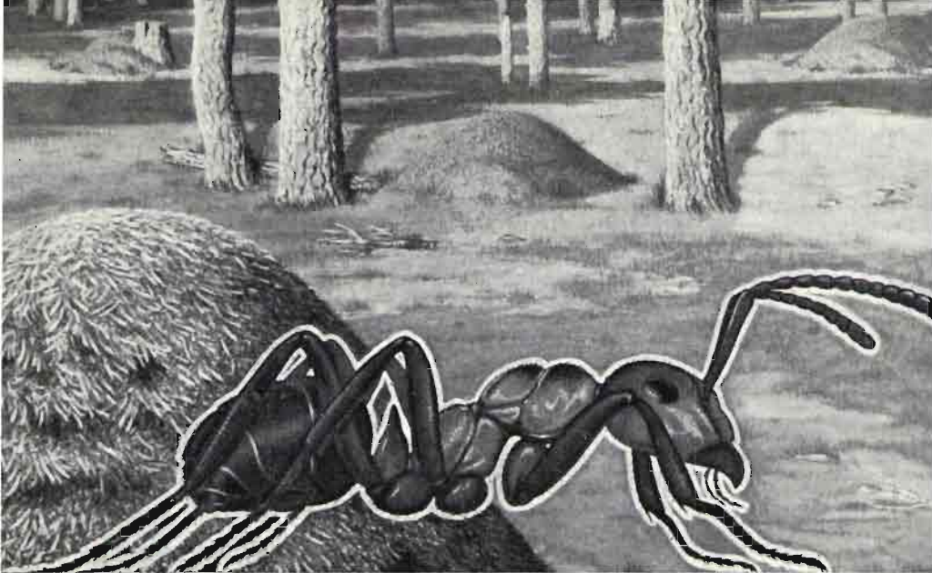
Fig. 1.—Las hormigas del grupo Formica rufa abren nuevas perspectivas en la lucha biológica contra las plagas forestales. (Reproducción del dibujo de la portada del Bol. de Plagas Forestales.)

En España tenemos todas estas especies a excepción de F. polyctena , cuyo óptimo está en Centro Europa. De las seis restantes, las que tendrán un porvenir mayor en nuestro país son F. nigricans , F. lugubris y F. rufa ; quizá Formica pratensis sea más apta para su empleo en zonas de mayor iluminación, pero al igual que F. aquilonia y F. sanguinea no son muy abundantes en lo que llevamos explorado hasta el día de hoy.