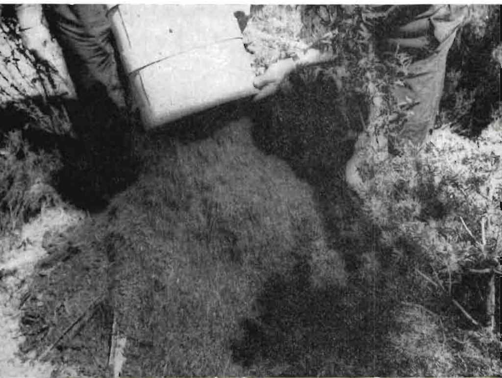
Fig. 5. Vertiendo el contenido de los bidones para la formación de un nuevo hormiguero.

Una vez llegado el material a su destino, deberán estar preparados los hoyos, con los tocones metidos y enterrados en parte, cubriéndose el resto con el acervo que traen los bidones;