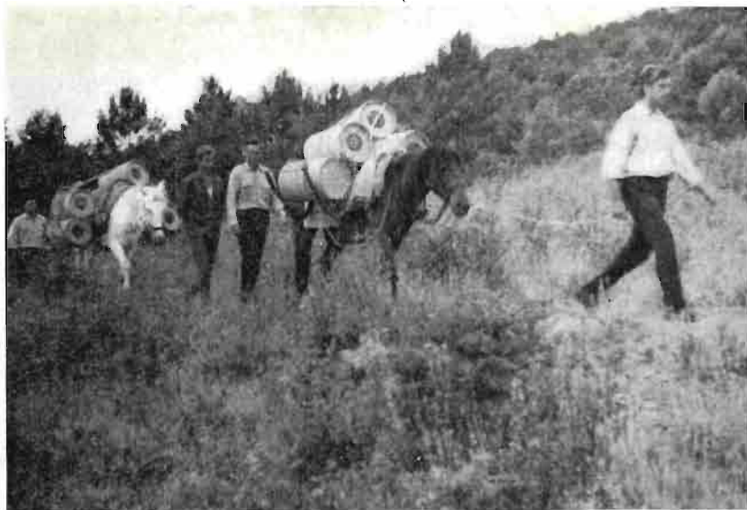
Fig. 7.—Transporte por terreno abrupto.